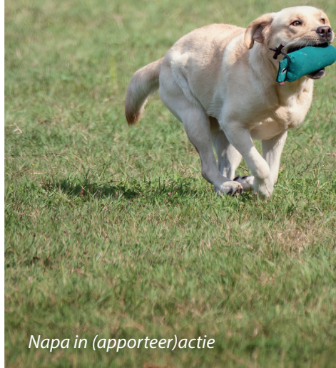
Napa in (apporteer)actie

keloos. Alleen de afwerking was niet helemaal perfect, maar dat zou ook te maken kunnen hebben met wat spanningen van mijn kant.